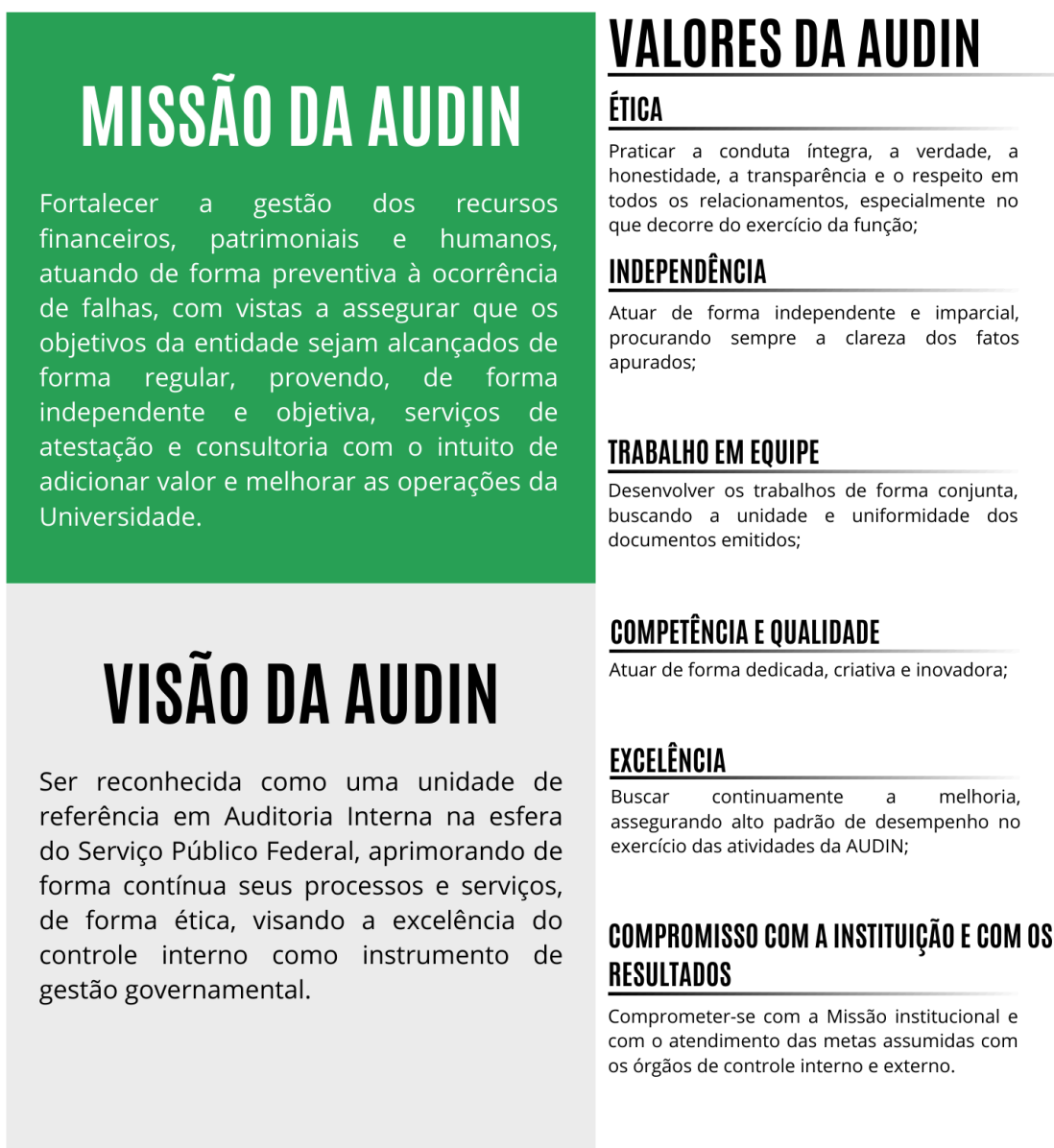
Figura 1 – Missão, Visão de Futuro e Valores da AUDIN UFRA