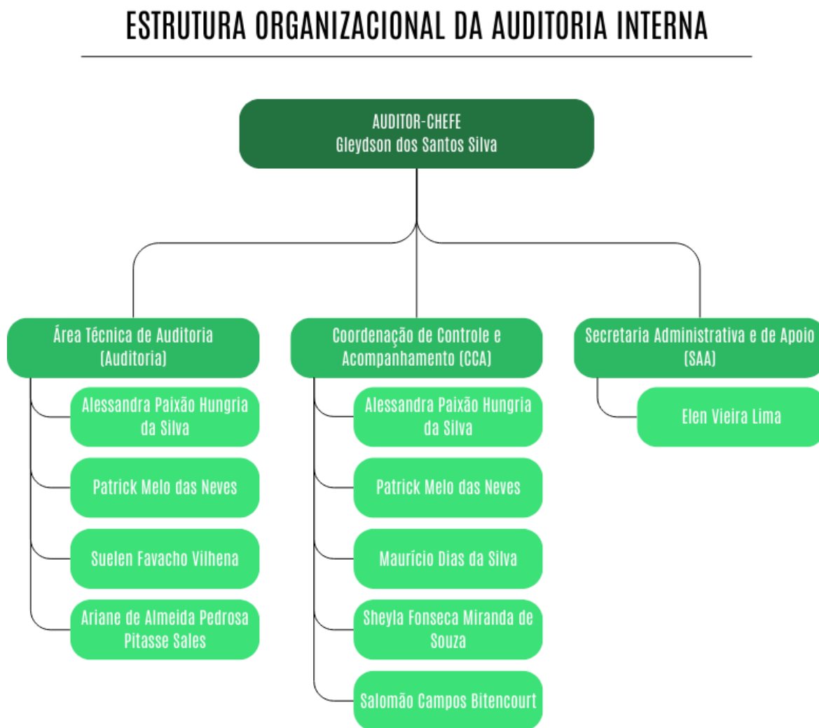
Figura 2 – Organograma da AUDIN UFRA

A seguir, o organograma apresenta a estrutura organizacional da AUDIN/UFRA, detalhando a divisão das responsabilidades e funções dentro da unidade, conforme estabelecido nos artigos 18, 30, 33 e 34 do Regimento Interno da AUDIN, aprovado pela Resolução CONSUN n.º 281, de 16 de setembro de 2020: