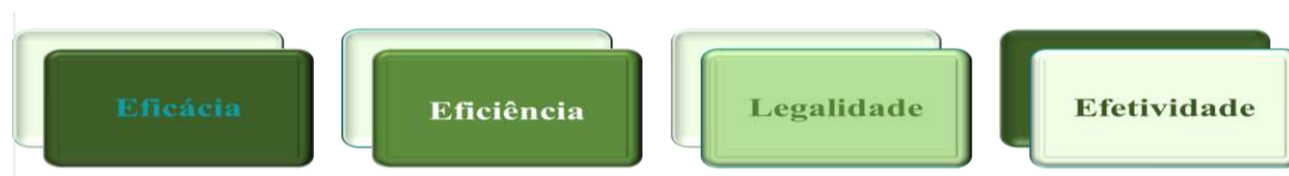
Figura 4 Princípios da Administração Pública

dos equipamentos de laboratórios conforme previsão legal); e, efetividade: (aquisição dos equipamentos de laboratórios sejam planejados em documento específicos cujas metas sejam atingidas de forma global na UFRA) (FIGURA 4).