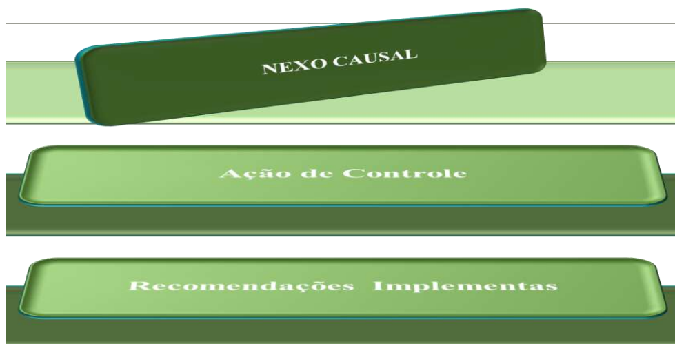
Figura 3 Nexo Causal Fonte: AUDIN, (2022)

Do conceito se depreende, que os benefícios resultam de uma via de mão dupla onde a AUDIN recomenda ações mitigadoras, a partir da análise dos riscos, e, a Alta Gestão deve implementá-las. De tal sorte, que o trabalho é conjunto e, em parceria para, no caso do relatório final de auditoria 05/2022, as repercussões do trabalho sejam notadas na melhoria nos processos de gestão dos equipamentos de laboratórios.